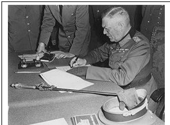
Вильгельм Кейтель подписывает Акт о безоговорочной капитуляции Германии

1 мая 1945 года в 3:50 на командный пункт 8-й гвардейской армии был доставлен начальник генерального штаба сухопутных сил вермахта генерал пехоты Кребс, заявивший, что он уполномочен вести переговоры о перемирии. Однако Сталин распорядился не вести переговоров, кроме как о безоговорочной капитуляции. Немецкому командованию был поставлен ультиматум: если до 10 часов не будет дано согласие на безоговорочную капитуляцию, советскими войсками будет нанесён сокрушительный удар. Не получив ответа, советские войска в 10:40 открыли ураганный огонь по остаткам обороны в центре Берлина. К 18 часам стало известно, что требования о капитуляции были отклонены. После этого начался последний штурм центральной части города, где находилась Имперская канцелярия. Всю ночь, с 1 на 2 мая, продолжались бои за канцелярию. К утру все помещения были заняты советскими